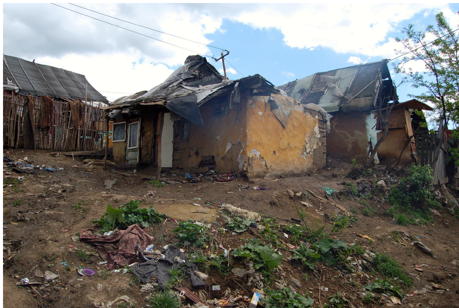
U gaf onder andere voor hen die hier wonen

Volgende week zullen de voedselpakketten getransporteerd worden naar Tirgu Mures in Roemenie.