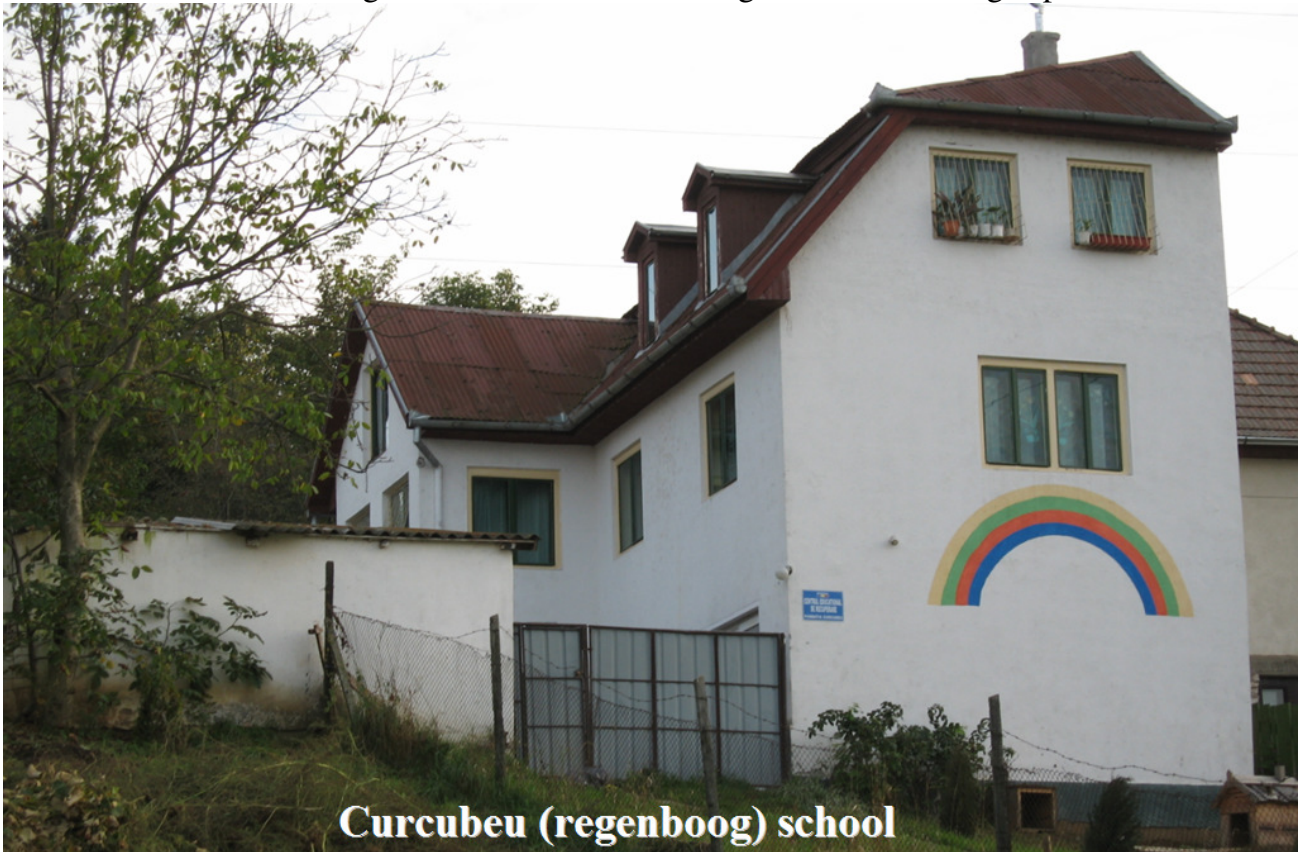
Curcubeu (regenboog) school

De buitenste dakbedekking van de school bestaat uit geverfde metalen golfplaten.