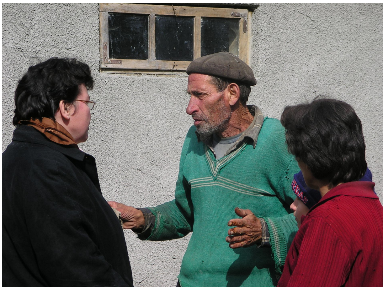
Matheus 25:40b "voor zoveel gij dit een van deze Mijn minste broeders gedaan hebt, zo hebt gij dat Mij gedaan."