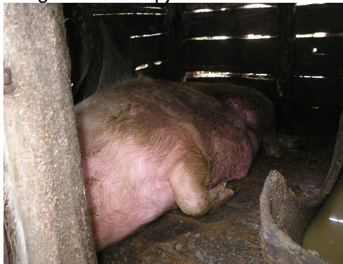
het varkenshok op het erf

family met 11 kinderen, waarvan 3 getrouwd; de familie heeft een stukje land en huurt land van de staat. Alleen de zoon van 16 (links op de foto) heeft een job bij een boer: hij wil later graag zijn eigen boerderij. De overige thuiswonenden hebben soms werk, de oudste dochter (midden) met problemen aan haar ogen, heeft wel werk maar een heel laag inkomen. Links op de linker foto is de pastor die deze gezinnen namens CE begeleidt en financieel ondersteunt van uw giften. De dochter en de zoon zijn met ons meegereden van het dorpje waar ze werken naar hun huis in het aangrenzende dorpje.