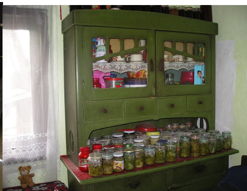
de enige slaap- en voorraadkamer

Toen we aankwamen werd er druk gewerkt in de stal, twee zonen waren een cementen vloer aan het leggen. Het cement was voor een deel uit het budget van CE betaald, maar dit was niet genoeg. Daarom gezamenlijk naar de lokale kruidenier gegaan die naast de gebruikelijke waren ook cement, jassen laarzen etc. verkoopt: een echte winkel van sinkel.